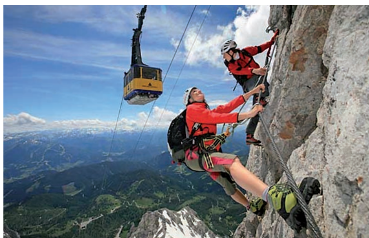
Abb. 6: Der neue Alpinismus, auf der Website von T-ONLINE am 26.8.2011 ganz oben...

Die harten Touristiker hypen noch die Flying Foxes, Alpspixe, Alpine-Coaster – und die bayerischen Politiker standen 2009 & 2011 ganz im Banne der Bewerbung um die Olympischen Winterspiele 2018. Aber das sind Fixierungen auf die bisherigen Formen eines Alpentourismus, der aus dem Prinzip des Vertikalen seinen Profit schlägt: Gaudi, Geschwindigkeit und Schrecken. Wann zerlegt es den