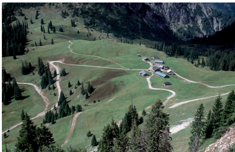
Abb. 4: Güllelandschaft Rotwandalm am Juifen/Alpenpark Karwendel/ Österreich.

Die Signale, dass auch der Naturschutz mit dem ungehobenen touristischen Schatz in den Bergen spekuliert, sind unübersehbar. Ein Beispiel: Im Alpenpark Karwendel, das Tiroler Pendant zum Bayerischen Naturschutzgebiet Karwendel, werden viele Almen den Zielen des Naturschutzes nicht gerecht. Die speziell in Österreich geltende Förderung der auf Almen produzierten Milch hat dazu geführt, dass Hochleistungsmilchkühe auf der Alm gehalten werden, die – wie im Tal – mit Kraftfutter versorgt werden müssen. Damit kommen bis zu 50% des Futters aus dem Tal auf die Alm – ein Energie-Überschuss, der dann nicht als "Kuhdatschi" von der Kuh nach Gusto verteilt, sondern als Gülle vom Almbauern über die Almflächen ausgebracht wird. Dazu werden teilweise eigene Güllewege in die Almflächen trassiert. Die Folge ist ein massiver Artenschwund auf den eigentlich artenreichen "Magerwiesen".