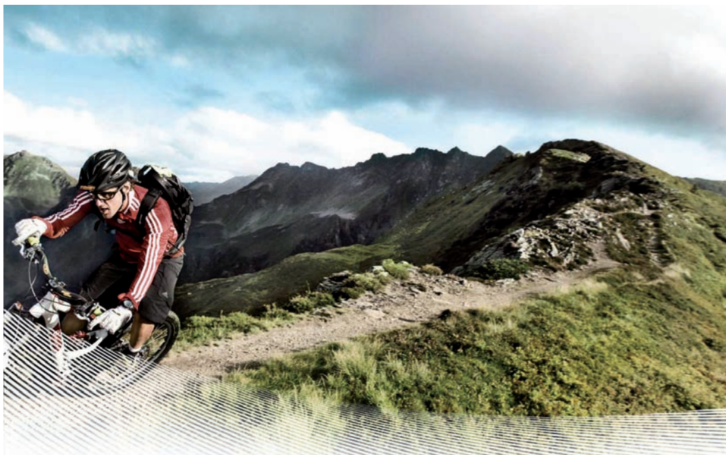
Abb. 7: TIROLWERBUNG auf der Website von T-ONLINE am 7.6.2010: Noch nachhaltig in der "Gegenwelt" unterwegs? Oder schon übers Ziel hinausgeschossen?