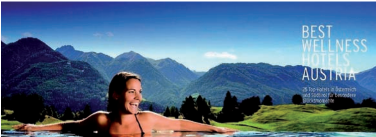
Abb. 3: Das Ideal des neuen alpinen Tourismus: Wellness im Unverfügbaren..

derne, die Angst vor den ruinösen Folgen früherer Exzesse in den Tälern, die Soft Skills der neuen Generation der Touristiker, dieses Syndrom will dieses Terra incognita aufbrechen.