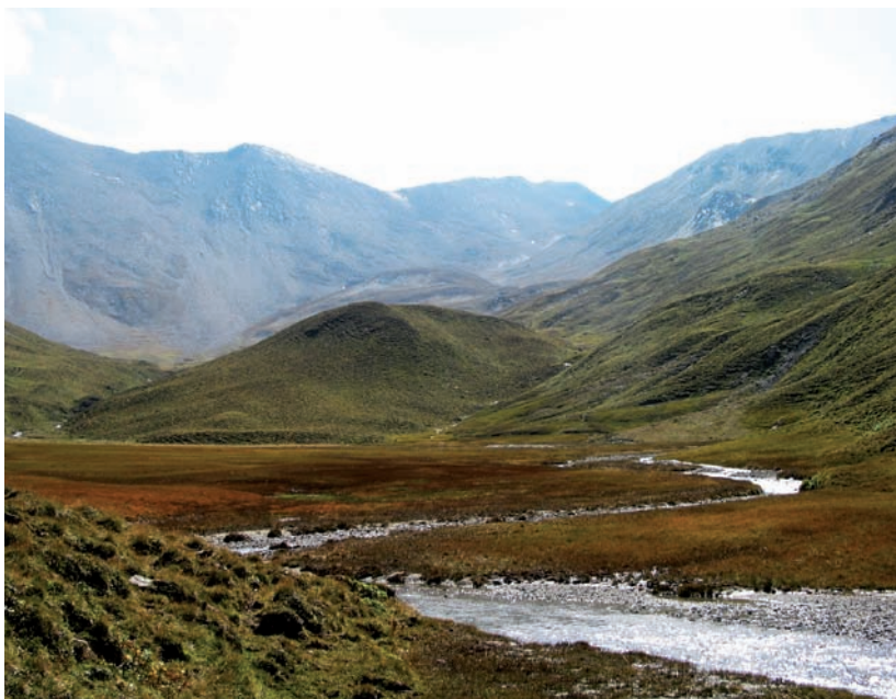
Abb. 2: Moor am Vesilbach. Oben rechts der Gipfelbereich des Piz Val Gronda / Paznaun / Tirol. (Foto: Karl Krainer).

Weniger zimperlich geht es im Worst-Case-Szenario "Rotlicht" aus derselben Veröffentlichung zu: "Aufgrund der Wetter-Extreme bricht der Tourismus drastisch ein. Allein der Billig-Tourismus bietet noch eine Existenzgrundlage. Was als Marktsegment übrig bleibt, sind Ballermann-Gäste, Koma-Trinker ("All-Inclusive"). Aber: jede Krise ist auch eine Chance. Zwei arbeitslose Kellner kamen auf die Idee, die Klima-Katastrophen aktiv zu vermarkten: etwa Felsstürze aus der Nähe zu verfolgen (Crash Watching)..."