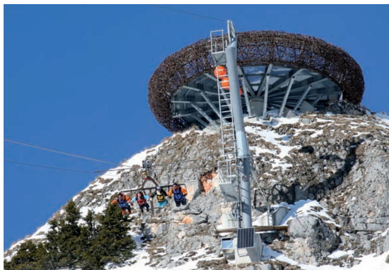
Abb. 5: Aussichtsplattform "Adlerhorst" und Flying Fox, Gschöllkopf 2039 m, Rofan/Tirol.

Grund, Werbung für sich zu machen. Aber die Idee der Vermarktung ist damit auch im Alpenpark Karwendel angekommen – ganz im Sinne des oben bereits erwähnten "Überlebens"-Programmes "Alp Austria".