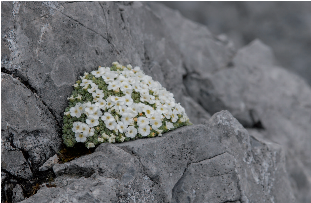
Abb. 9: Schweizer Mannsschild ( Androsace helvetica ) wächst auf hochgelegenen und exponierten Kalk- und Dolomitfelsen.