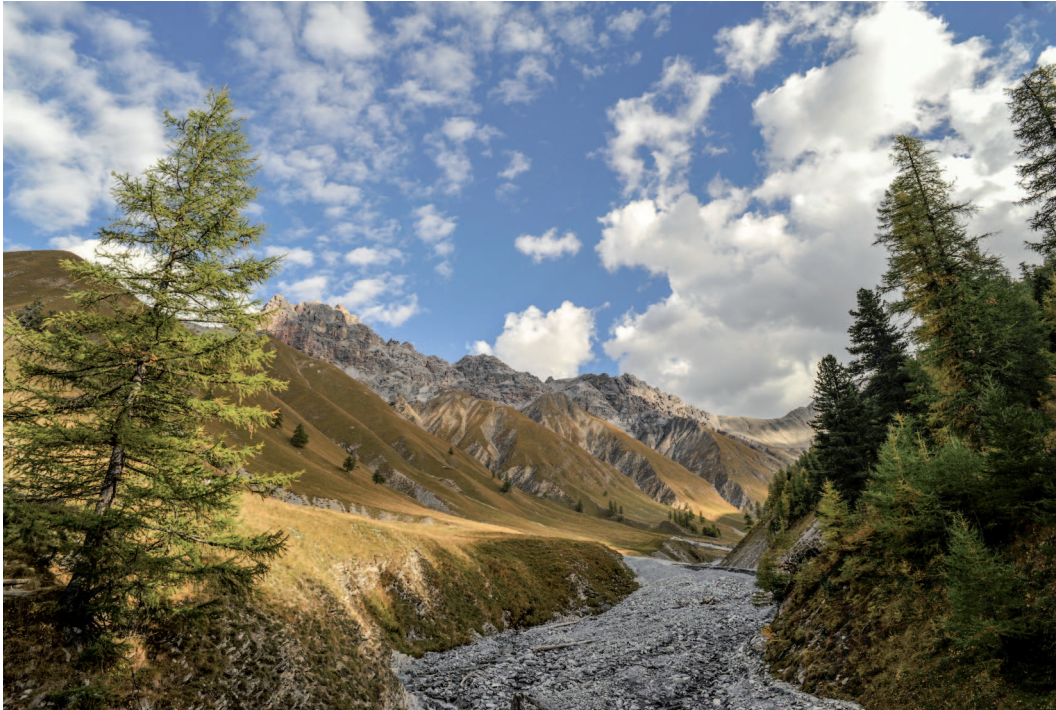
Abb. 2: Die Val Trupchun ist bekannt für ihren Reichtum an Huftieren, insbesondere Rothirsche.