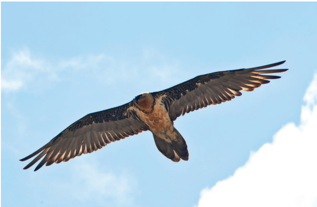
Abb. 7: Von 1991 bis 2007 wurden im Schweizerischen Nationalpark insgesamt 26 Bartgeier ( Gypaetus barbatus ) in die Freiheit entlassen.