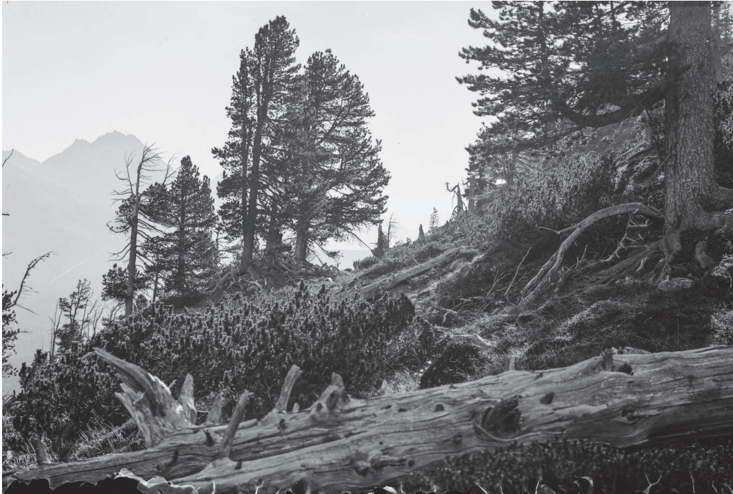
Abb. 10: Zirben- Bergföhrenwald zur Gründungszeit des Schweizerischen Nationalparks.