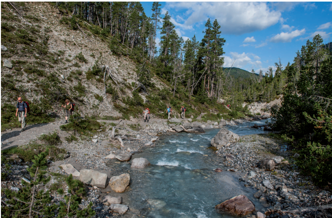
Abb. 3: Der in den Spöl mündende Fuornbach ist im Bereich Il Fuorn ein vitaler Bergbach, der später leider im Ausgleichsbecken Ova Spin für das Engadiner Kraftwerk Pradella/Scuol endet.