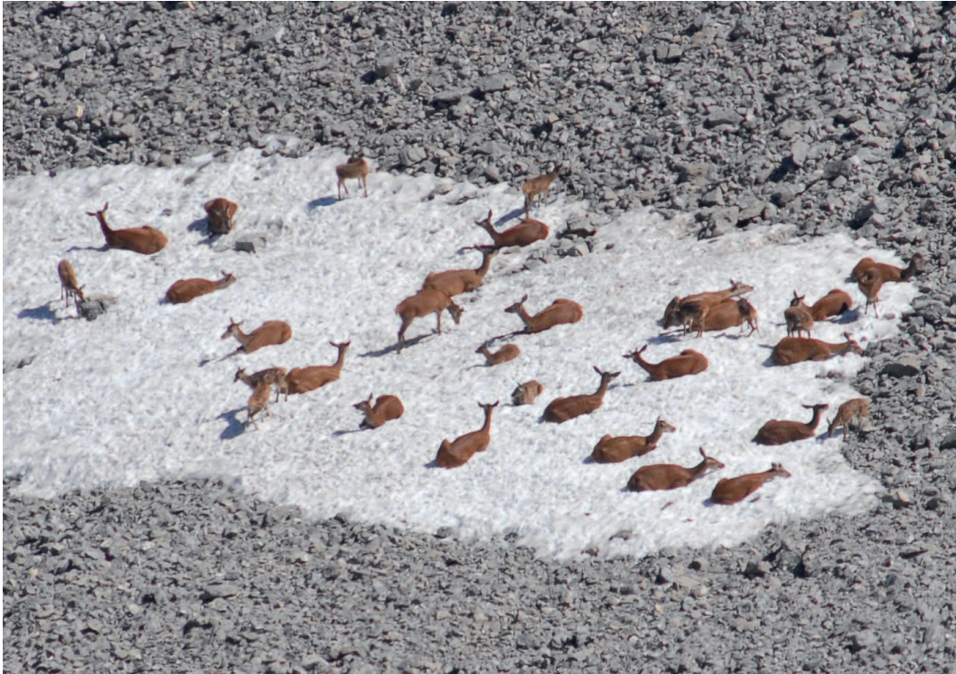
Abb. 6: Im Sommer kühlen sich die Rothirsche auf den letzten Schneefeldern ab..