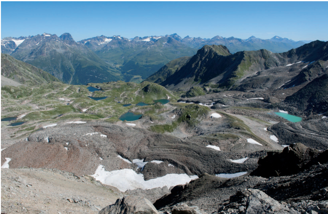
Abb. 5: Die Seenplatte von Macun auf 2600 m ü.M. ist ein Gletscherkar mit 23 Seen. Im rechten Bildteil sind die Blockgletscher gut erkennbar. (Foto SNP/Hans Lozza).