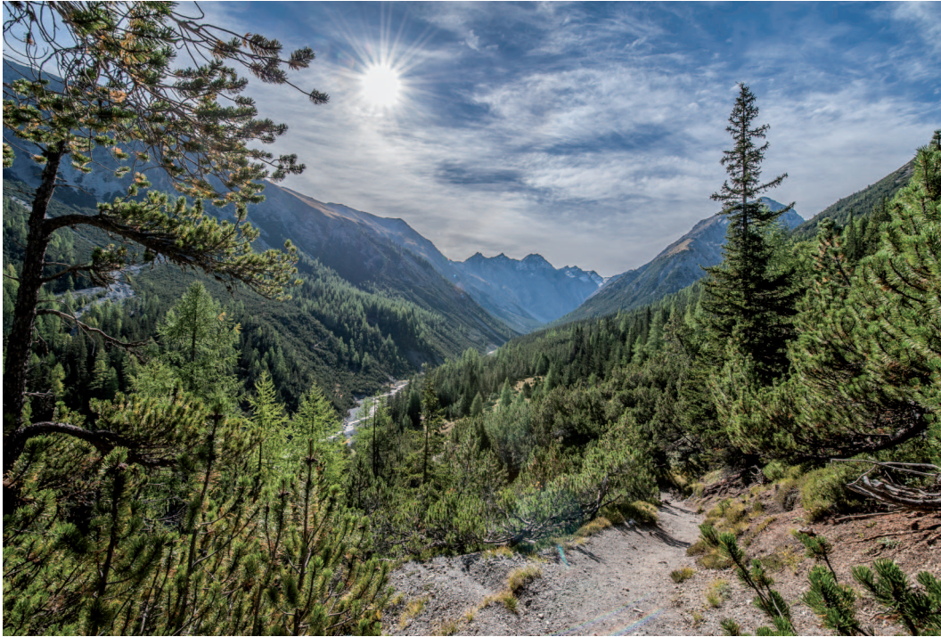
Abb. 4: Blick in die Val Cluozza, dem ersten Tal, das bereits 1909 Teil des Nationalparks wurde.