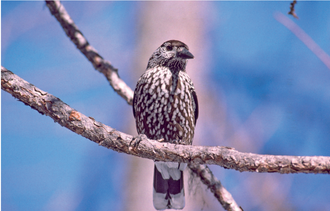
Abb. 8: Der Tannenhäher ( Nucifraga caryocatactes ) ist der Signetvogel des Schweizerischen Nationalparks. Jeder Vogel versteckt pro Jahr bis zu 100.000 Zirbennüsse im Boden und findet 80 Prozent davon im Winter wieder. Aus den restlichen wachsen junge Zirben. (Foto SNP/Hans Lozza).