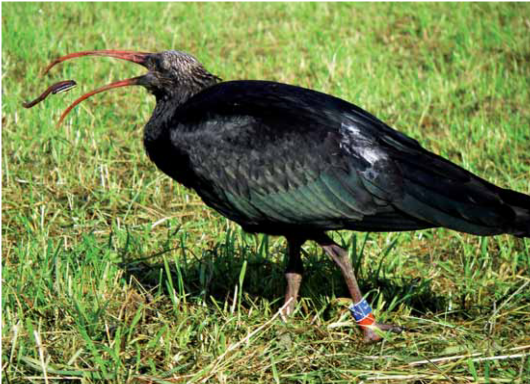
Abb. 4: Waldrappe sind taktile Jäger, sie ertasten die Nahrungstiere im Boden, vorwiegend Würmer und Larven. In ariden Gebieten jagen sie aber auch nach Vertebraten und Evertebraten an der Erdoberfläche.

Waldrappe sind insbesondere taktile Jäger. Mit ihrem sensiblen, fein innervierten Schnabel "ertasten" sie im Boden lebende Wirbellose (Insekten und deren Larven, Würmer, Schnecken und deren Gelege) und nehmen Käfer vom Boden auf. Daneben machen Heuschrecken und andere bewegungsaktive Insekten, kleine Wirbeltiere und zarte Pflanzenteile nur einen geringen Anteil der Nahrung aus. Die Zusammensetzung der Nahrung variiert jedoch nach Habitat und Häufigkeit der potenziellen Beutetiere. Flächen mit Massenaufreten von Nahrungstieren, wie z.B. Mai- und Junikäferlarven oder Zuckmückenlarven, werden von Waldrappen oft über Wochen und Monate genutzt, wobei der Anteil der betreffenden Futtertierart dann mehr als 90% ausmachen kann (ZOUFAL et al. 2007). Dann werden auch aktive Insekten wie z.B. Wanderheuschrecken erbeutet, die sonst wenig Beachtung finden.