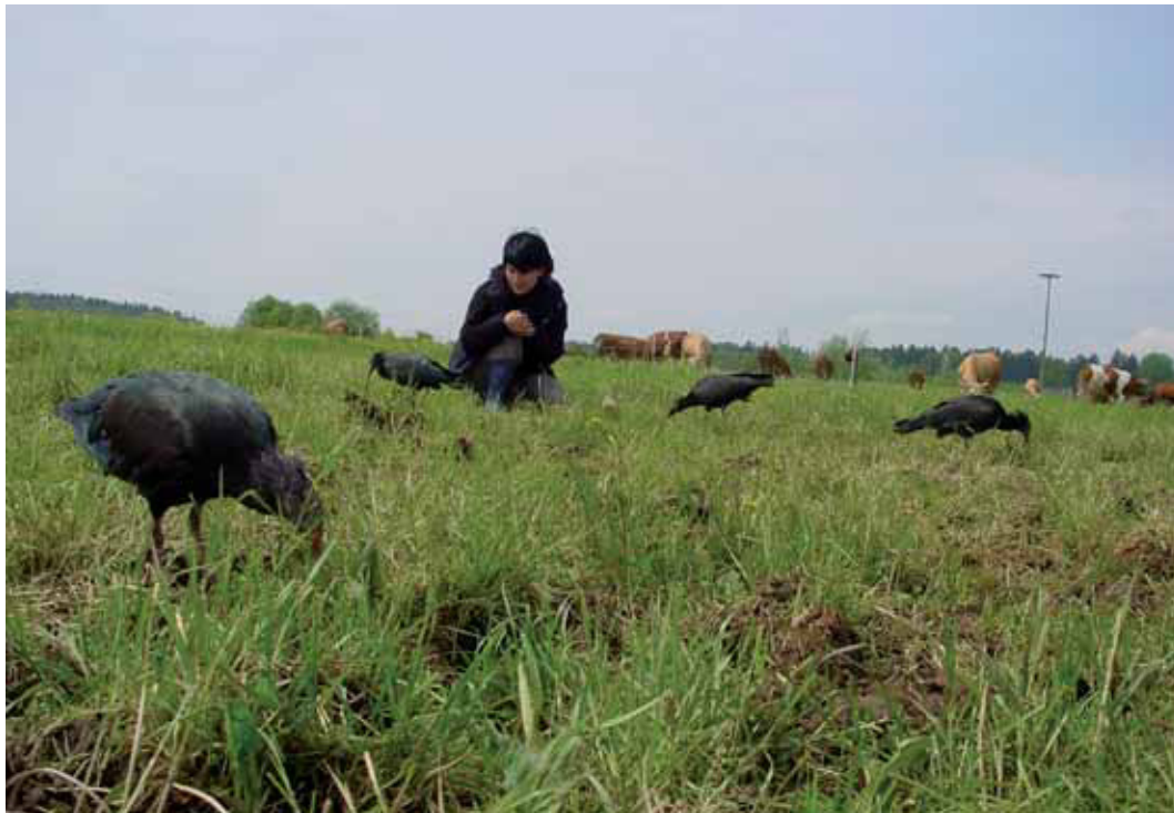
Abb. 3: Ein Waldrapp bei der Nahrungssuche auf einer Weidefläche. Landwirtschaftliche Nutzflächen sind die primären Nahrungshabitate, nicht nur in Mitteleuropa, sondern an allen noch vorhandenen Koloniestandorten.

Das Verhalten der freifliegenden Waldrappe in Europa deckt sich mit jenem der verbliebenden freilebenden Waldrappe außerhalb Europas. Sie nutzen fast ausschließlich extensiv bewirtschaftete Weiden, Äcker und Wiesen mit niedriger Vegetation. Ebenso wie Weißstörche sind Waldrappe Kulturfolger, die von der mittelalterlichen Landwirtschaft profitiert haben (PERCO & TOUT 2001). In Mitteleuropa schufen Rodungen der ausgedehnten Urwälder erst geeignete Nahrungshabitate. Aus historischen Quellen und Beobachtungen weiß man, dass der Waldrapp im Umfeld des Menschen gelebt hat. Die Salzburger Vögel und die großen Kolonien in Birecik und Raqqa brüteten sogar in direkter Nachbarschaft zur Bevölkerung der Stadt.