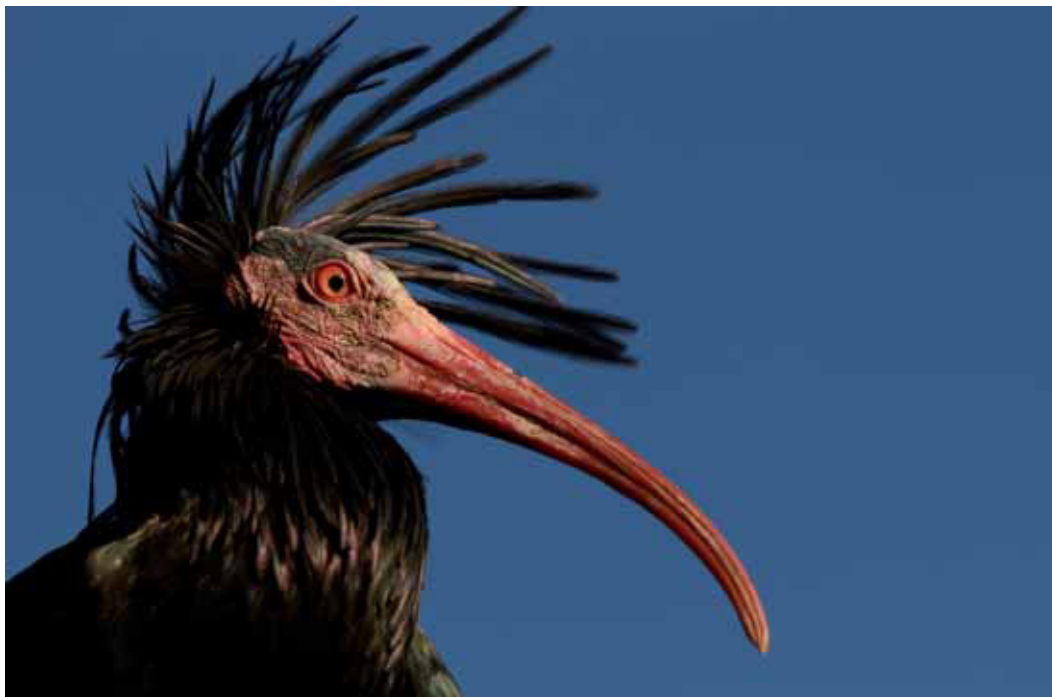
Abb. 1: Portrait eines Adultvogels mit dem charakteristischem Federschopf und der schwarz-roten Kopfzeichnung.

sion im Rahmen des Förderprogramms LIFE+ Biodiversity zuerkannt. Das Projekt hat zum Ziel, im Zeitraum bis 2019 drei Brutkolonien nördlich der Alpen anzusiedeln, mit einer gemeinsamen Zugroute in ein Wintergebiet in der südlichen Toskana. Somit besteht eine konkrete Chance, dass es in naher Zukunft wieder durch den Alpenraum migrierende Kolonien dieser charismatischen Vogelart gibt. Eine nachhaltige Wiederansiedlung in Europa wird aber nur möglich sein, wenn die Verluste durch illegale Abschüsse in Italien substantiell reduziert werden können.