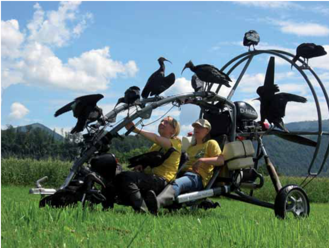
Abb. 6: Den auf die Bezugsperson geprägten Waldrappen können sukzessive die notwendigen Eigenschaften und Erfahrungen für ein selbständiges Überleben antrainiert werden.

Methoden gegründet werden. Gegenwärtig gibt es neben dem Waldrappteam nur ein vergleichbares Projekt in den USA. Dort werden die vom Aussterben bedrohten Schreikraniche ( Grus americana ) vom Aufzuchtgebiet in Wisconsin über rund 1.800 km in ein geeignetes Wintergebiet in Florida geführt (HARTUP et al. 2005; MUELLER et al. 2013).