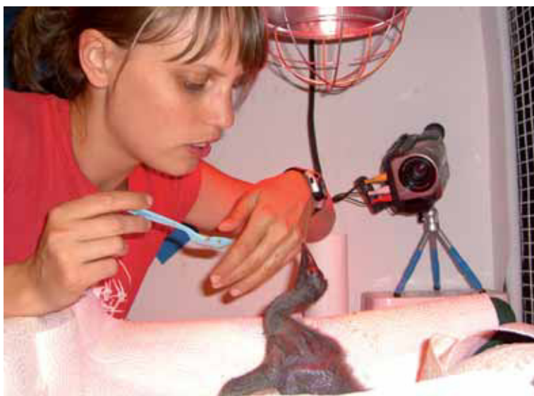
Abb. 5: Im Rahmen der Wiederansiedlung werden die Waldrapp-Küken von menschlichen Zieheltern aufgezogen. Eine optimale Handaufzucht ist die Grundvoraussetzung für eine erfolgreiche Freilassung.

2002 wurde das Projekt Waldrappteam gegründet. Die Mitarbeiter haben sich zum Ziel gesetzt, eine Methode zu finden, um mit Nachzuchten aus Zoos selbständige, migrierende Waldrappkolonien anzusiedeln. Jahr für Jahr werden zu diesem Zweck junge Waldrappe von menschlichen Zieheltern aufgezogen und darauf trainiert, einer dieser Bezugspersonen in einem Ultraleicht-Fluggerät zu folgen. Im Spätsommer werden sie dann etappenweise vom Brutgebiet in ein geeignetes Wintergebiet in der südlichen Toskana geführt. So kann eine neue Zugtradition gegründet werden, die von den handaufgezogenen Vögeln wiederum an ihre Nachkommen weitergegeben wird und so fort. Bislang wurden insgesamt acht menschengeleitete Migrationen durchgeführt. Ausgangsort waren insbesondere Burghausen in Bayern (2007-2010) und Anif bei Salzburg (2011). Das Projekt wurde durch Filmdokumentationen und Medienberichte international bekannt.