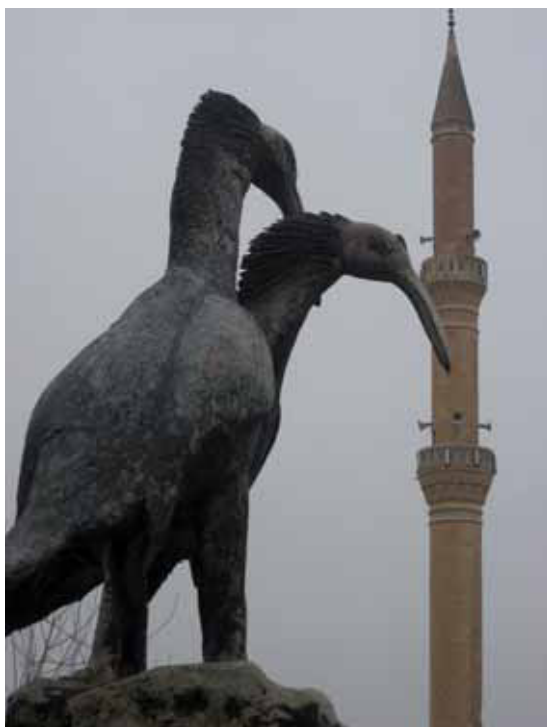
Abb. 2: Waldrappstatue in der Stadt Birecik in der Türkei. Nach wie vor wird in der Stadt jedes Frühjahr zu Ehren des Vogels das Kelaynak-Fest gefeiert, ob- schon seit Jahrzehnten keine Waldrappe mehr aus dem Wintergebiet zurückkehren.

Der Waldrapp hat durch seine auffällige Gestalt und die von ihm gezeigte Nähe zu menschlichen Siedlungen in verschiedenen Kulturen nachhaltige Spuren hinterlassen. Im Alten Ägypten stand seine Hieroglyphe «Akh» für die höchste Form des Seins, er galt als Mittler zwischen der Welt der Toten und der Lebenden (JANÁK 2011). Auch für die Einwohner der türkischen Stadt Birecik war der Waldrapp ein heiliger Vogel. Er sei, von Noah nach der Landung der Arche ausgeschickt, zu einem kleinen Haus am Euphrat geflogen; dort soll sich der Sage nach die Stadt Birecik (= kleines Haus) entwickelt haben (HIRSCH 1976). Fortan galt er bei seiner Rückkehr als Frühlingsbote, als Träger der Seelen und – bedingt durch den Herbstzug – als Führer der Pilger gen Mekka. Waldrappe galten – vermutlich durch ihren Federschopf