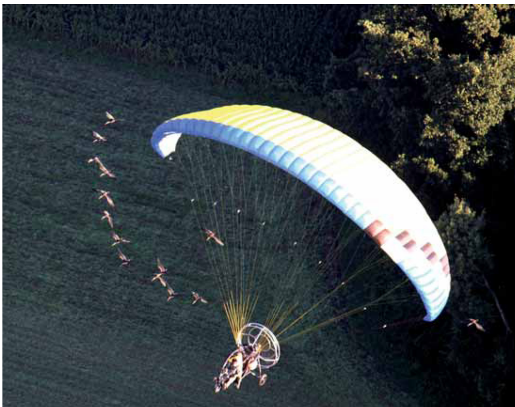
Abb. 7: Nach langem Training folgen die menschenaufgezogenen Waldraupe dem Fluggerät und können so vom Brutgebiet in das Wintergebiet geführt werden.

Bei den ersten Migrationsflügen hatten die Tagesfluetappen eine mittlere Länge von rund 50 km. Bei der letzten bislang durchgeführten Migration 2011 lag die Tagesflugdistanz dagegen bei rund 220 km, mit einem Maximum von 364 km. Diese beträchtliche Verlängerung der Fluetappen hat insbesondere umfangreiche Erfahrungen mit dem Flugverhalten der Waldraupe und die Optimierung der