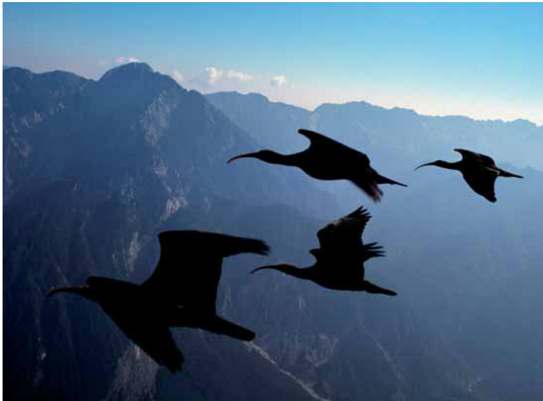
Abb. 10: Bei ihren Migrationsflügen queren die Waldtrappe den Alpenbogen. Ab 2014 werden auch die handaufgezogenen Jungvögel mit den Ultraleicht-Fluggeräten dieser Route folgend direkt über die Alpen nach Süden fliegen.