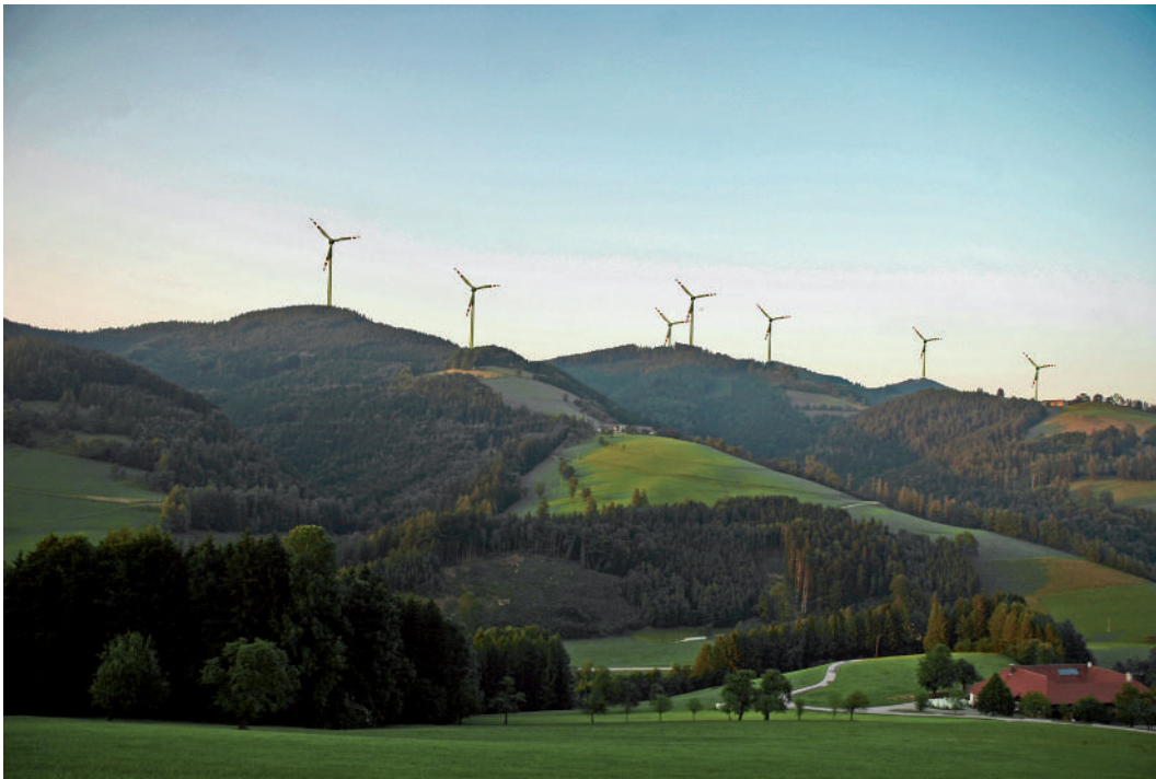
Abb. 3: Bei den Planungen für den Windpark am Eiskogel/OÖ herrscht derzeit "Windstille" – nach dem "Windenergiemasterplan Oberösterreich" würde er in einem Ausschlussgebiet liegen.

Überformung vor allem des Steyr- und Ennstales im Vorfeld des Nationalparks Kalkalpen sowie einer Entwertung des Natur- und Erholungsraumes einsetzen.