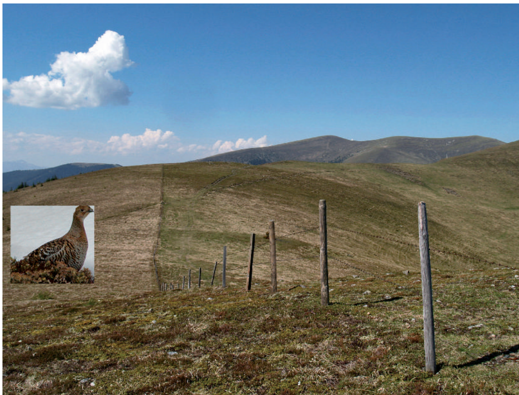
Abb. 5: Viele Kammlagen in der Steiermark sind aufgrund ihres Windpotenzials zu Objekten der Begierde geworden – hier ein Blick von der Roßbachalm zur Terenbachalm im Bezirk Voitsberg. Gerade diese Gebiete im Übergangsbereich der Waldgrenze sind wertvolle Lebensräume für das geschützte Birkwild.

Hochpürschting im Bezirk Mürzzuschlag (9 WKA). Äußerst umstritten ist ein weiteres Projekt im Bezirk Mürzzuschlag, nämlich direkt oberhalb der Stadt Mürzzuschlag auf der Scheibe. Dort sollen zwischen Dürrkogel und Großer Scheibe in unmittelbarer Nähe zu den hoch frequentierten Wanderwegen rund um die Scheibenhütte als alpiner Schutzhütte und äußerst beliebtem Ausflugsziel 6 WKA errichtet werden. Das Projekt ist vor Ort auf großen Widerstand gestoßen, insbesondere die OeAV-Sektion Mürzzuschlag hat sich intensiv um Aufklärung und Sensibilisierung der Bevölkerung bemüht. Eine Unterschriftenaktion hat über 1.000 Unterschriften gegen das Projekt gebracht. Derzeit scheinen die Planungen still zu liegen.