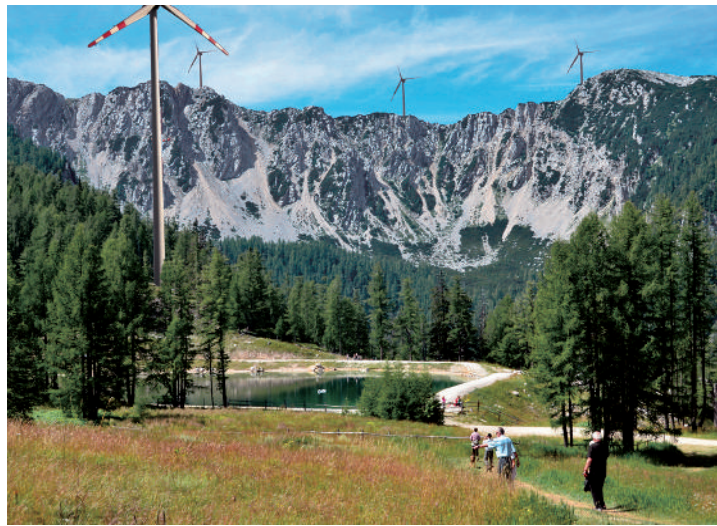
Abb. 4: Fotomontage des geplanten Windparks auf der Petzen/ Kärnten – Landschaftszerstörung auf "höchster Ebene". (es handelt sich hierbei um keine größen- bzw. maßstabsgetreue Montage).

Steinadler oder Bartgeier – beide sind streng geschützt – enorme Gefahrenquellen dar und sind daher an diesen Standorten nicht zu verantworten. Ebenfalls höchst umstritten sind Pläne zur Realisierung von 3 WKA im Skigebiet Großglockner-Heiligenblut. Auch dieses geplante Projekt befindet sich in unmittelbarer Nähe des Nationalparks Hohe Tauern-Kärnten und wird vom OeAV als "landschaftszerstörendes Bauvorhaben" strikt abgelehnt 15 . Eine grenzüberschreitende Ablehnung, allen voran durch die "Aktionsgemeinschaft Lebensraum Petzen", in der auch der OeAV vertreten ist, trifft das geplante Projekt mit 8 WKA mit einer Gesamthöhe von 130 m auf der Petzen. Die Petzen ist ein Grenzberg zwischen Kärnten und Slowenien, geologisch und naturschutzfachlich (teilweise Natura 2000!) höchst sensibel, Wasserschutz- bzw. Wasserschongebiet und ein Wahrzeichen in der Verbindung zwischen Kärnten und Slowenien. Der OeAV mit seinem Landesverband Kärnten lehnt das Projekt kategorisch ab. Damit droht die großflächige Zerstörung einer ursprünglichen und einzigartigen Gebirgslandschaft. 16