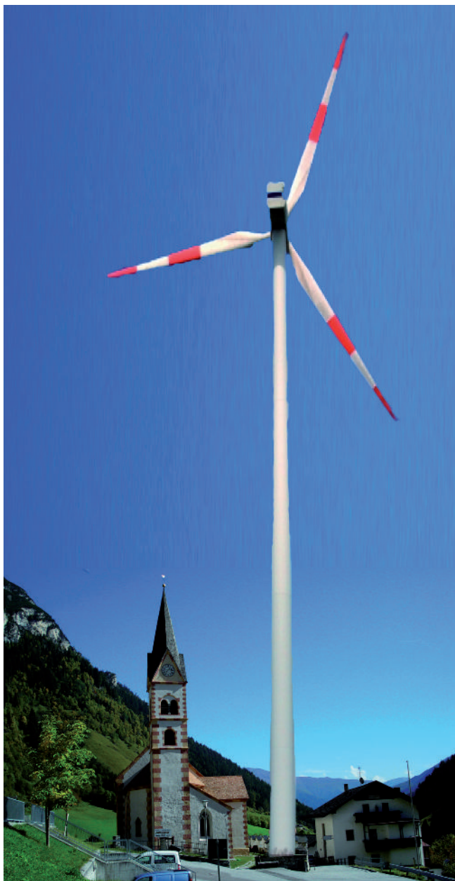
Abb. 7: Größenvergleich zwischen dem Kirchturm der Gemeinde Pflersch und den geplanten WKA am Sattelberg – die Windräder waren drei Mal so hoch wie der Pflerscher Kirchturm. (Quelle: Alpenverein Südtirol).

So kam es, dass der Umweltbeirat feststellte, der Windpark sei nicht umweltverträglich. Der Umweltbeirat ist ein von der Südtiroler Landesregierung bestelltes technisches Beratungsorgan, das sich aus sechs sachverständigen Landesbediensteten und zwei externen Sachverständigen zusammensetzt. Wie bereits erwähnt, betonte er in seinem Gutachten, dass mit dem Projekt eine landschaftliche Beein-