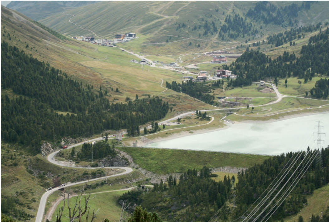
Abb. 1: Austauschbare alpine "Allerweltslandschaft": Seilbahnen & Pisten, Speicherteich, Hochspannungsleitungen, Hotelkomplexe; hier am Beispiel Sellrain/Tirol auf 1900 m Höhe. (Foto: J. Essl).

stehen würde. Die fehlende Landschaftsdebatte ist das Ergebnis des jahrelangen Ausblendens dieses wichtigen Raumthemas. Es sei angemerkt, dass die Republik Österreich bisher kein Interesse gezeigt hat, die Europäische Landschaftskonvention 1 zu ratifizieren.