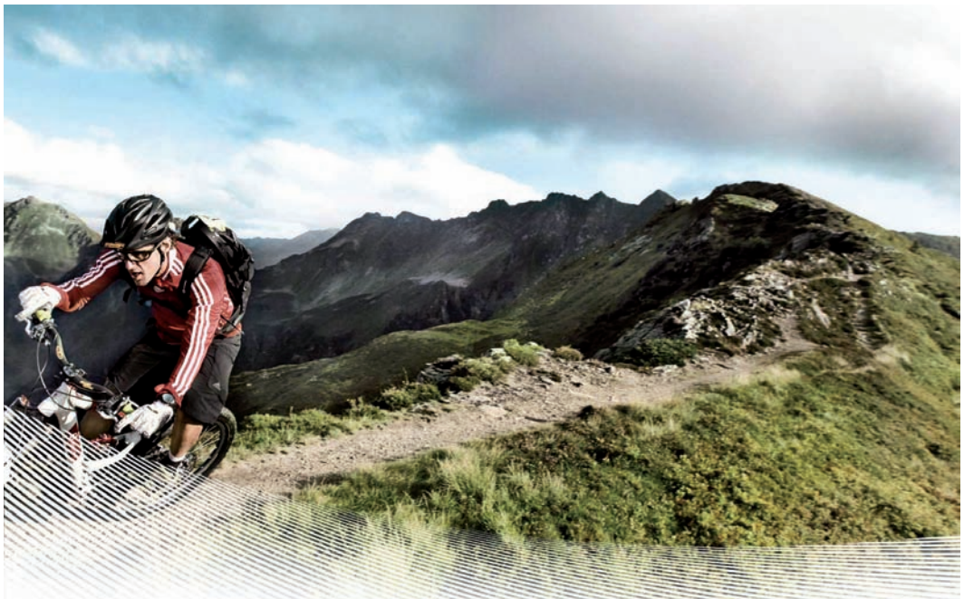
Abb. 7: TIROLWERBUNG auf der Website von T-ONLINE am 7.6.2010: Noch nachhaltig in der "Gegenwelt" unterwegs? Oder schon übers Ziel hinausgeschossen?